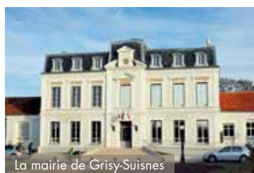
La mairie de Grisy-Suisnes

Située à 20 min de Melun et à moins de 25 km des villes nouvelles de Sénart et de Marne-la-Vallée, la ville conjugue proximité avec des pôles d'activités dynamiques et esprit de village !