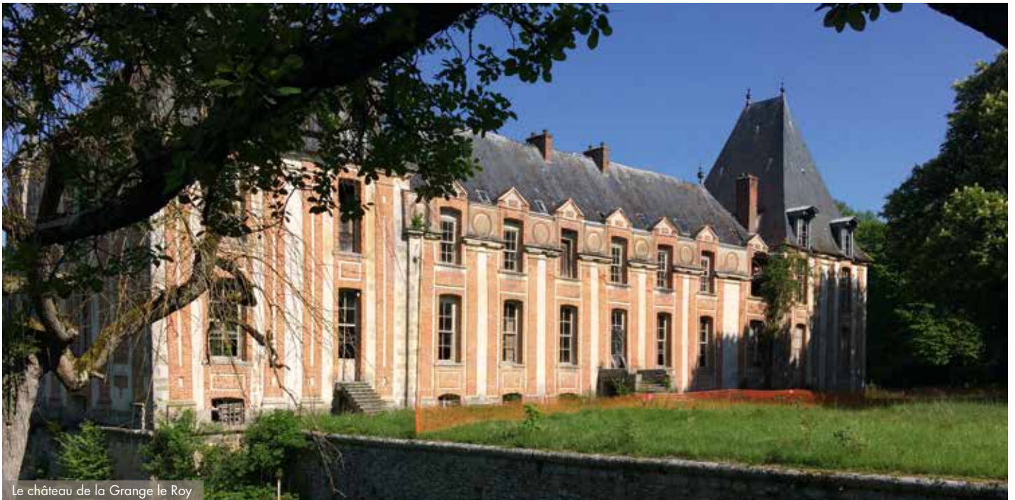
Le château de la Grange le Roy