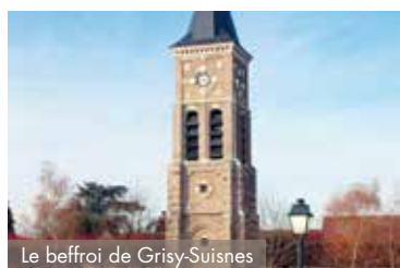
Le beffroi de Grisy-Suisnes