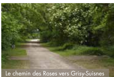
Le chemin des Roses vers Grisy-Suisnes