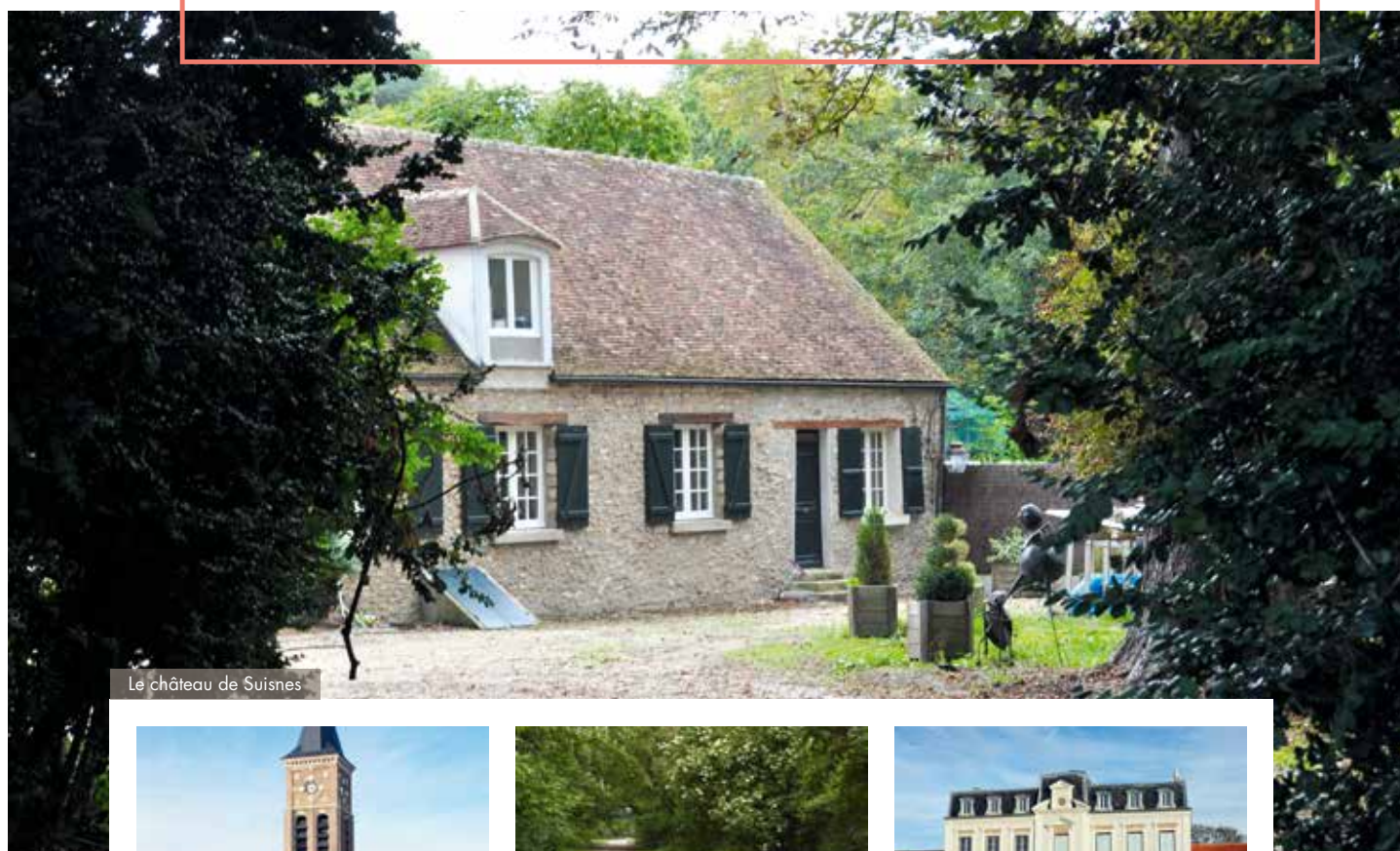
Le château de Suisnes

À 30 km de la porte de Bercy, située sur le verdoyant plateau briard, une charmante commune de Seine-et-Marne de 2 500 habitants vous ouvre ses portes : bienvenue à Grisy-Suisnes !